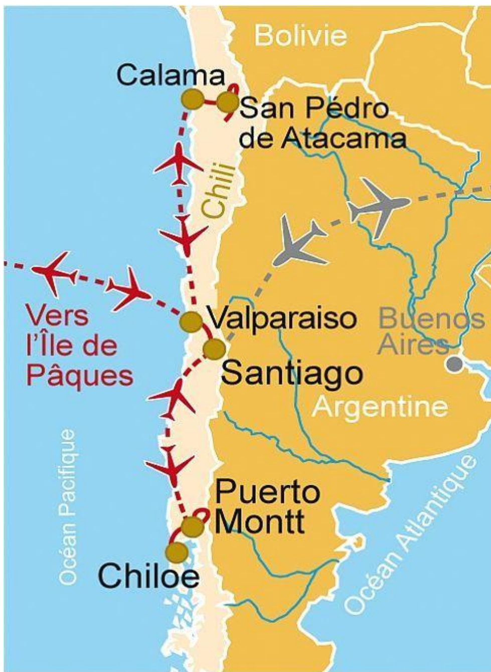
Circuit de 16 jours