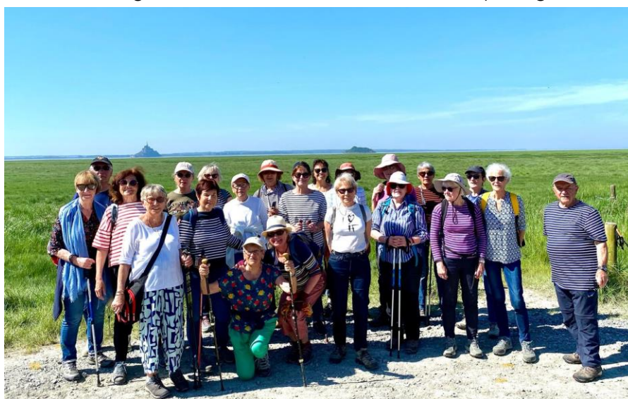
Photo prise lors du séjour en Normandie devant le Mont-Saint-Michel