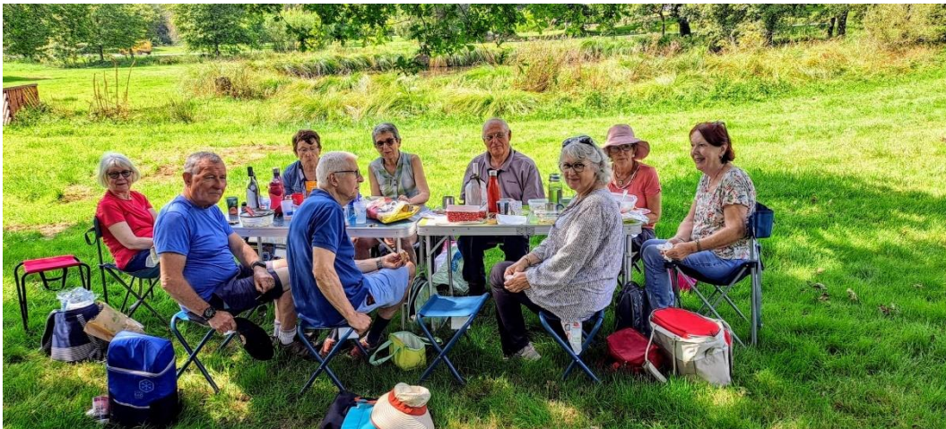
Randonnée du 1 er août à Guern